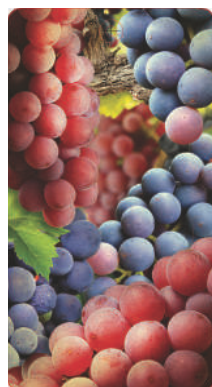
Сторона 1 62x115мм