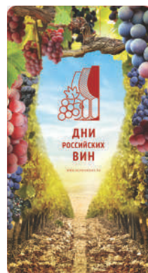
Сторона 2 62x115мм